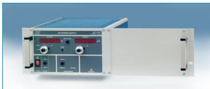
Rack- Adapter für ein 1/2 19"- Gerät mit 1/2 19" Blindplatte