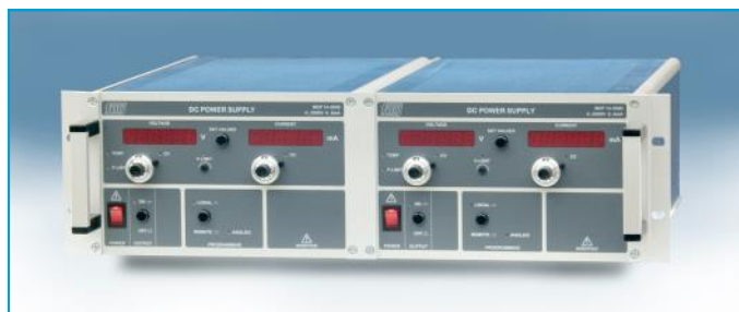
Rack- Adapter für zwei 1/2 19"- Geräte