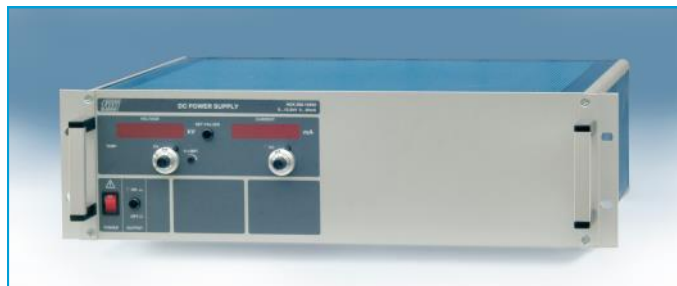
Rack- Adapter für ein 19"- Gerät

Bei Nachbestellung von 19" Rack- Adaptern bitte die Frontplattenhöhe angeben!