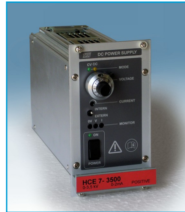
Optional kann die Frontplatte mit einem Zehngangpotentiometer zur Spannungseinstellung ausgerüstet werden.