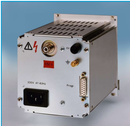
Rückseite mit Netzanschluss, Hochspannungsausgang und serienmäßiger Analogprogrammierung